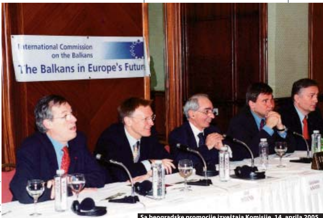
Sa beogradske promocije izveštaja Komisije, 14. aprila 2005.

Status quo je problem delom zbog toga što ga građani regiona tako doživljavaju.