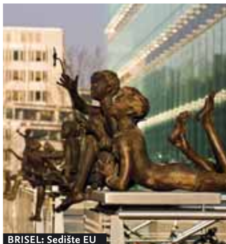
BRISEL: Sedište EU

Na sposobnost Evropske unije za apsorpciju, ili bolje sposobnost za integraci-