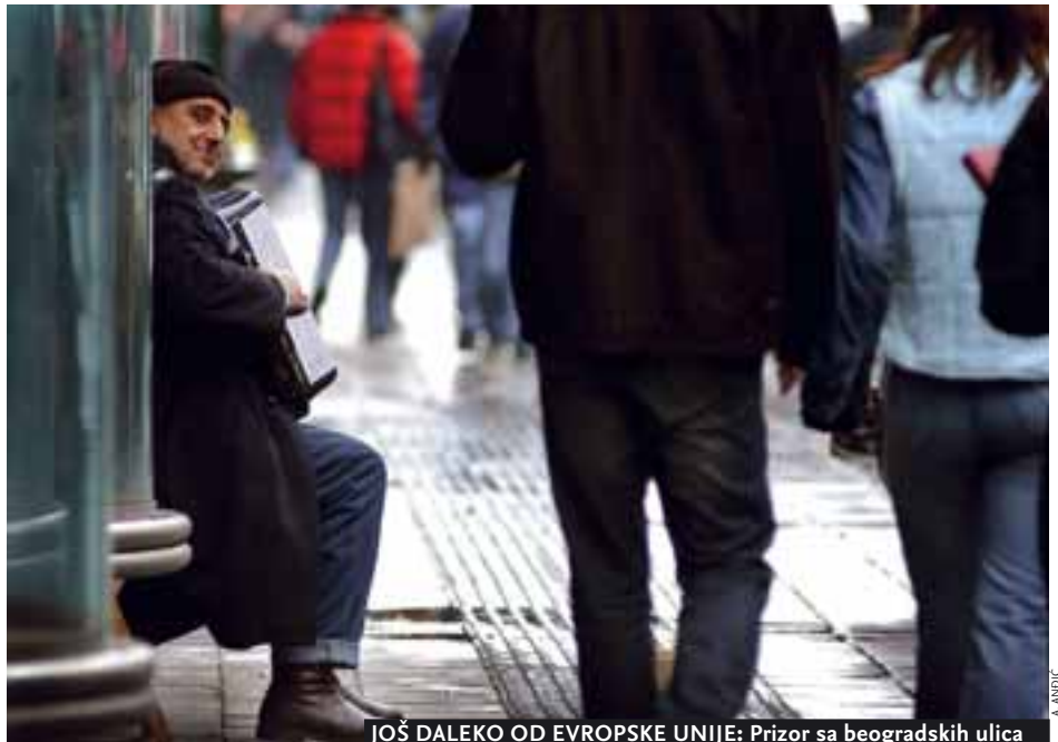
JOŠ DALEKO OD EVROPSKE UNIJE: Prizor sa beogradskih ulica

Nažalost, dosta toga u najnovijem izveštaju Evropske komisije ide u prilog takvom mišljenju. Nedovoljno poštovanje manjinskih prava, slobode veroispovesti, ravnopravnosti žena i sindikalnih prava, kao i nedostatak civilne kontrole nad vojskom samo su neke od najvažnijih zamerki upućenih Turskoj.