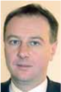
PIŠE: DR BRANKO MILINKOVIĆ

Saradnja balkanskih zemalja u oblasti bezbednosti najvećim delom podstaknuta je sa strane, fragmentirana, nedovoljno promovisana u samom regionu i nedovoljno poznata van njega