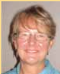
PIŠE: DR DŽUDI BAT

Reforme se traže zbog vaših sopstvenih interesa, ne samo zbog Evropske unije. Kredibilni partner Evropske unije je onaj koji u svakom slučaju sprovodi reforme i određuje tempo za EU – kao što su Srednjoevropljani radili u toku 90-ih