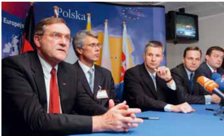
MINISTRI SPOLJNIH POSLOVA I ODBRANE ZEMALJA EU NA ZAJEDNIČKOM SASTANKU U BRISELU

– Predstavnici osam država u Briselu parafirali su Srednjoevropski sporazum o slobodnoj trgovini (CEFTA), a Srbija i BiH to nisu uradile zbog još nekoliko nerasčišćenih pitanja. Očekuje se da i ove dve zemlje otklone prepreke i parafiraju ga do početka decembra, kako bi premijeri svih deset zemalja članica potpisali sporazum 19. decembra 2006. u Bukureštu.