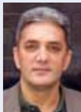
PIŠE: DR PETAR ATANASOV

Cilj evropske bezbednosne politike treba da bude humana bezbednost, koja se zasniva na ljudima, a ne na državama