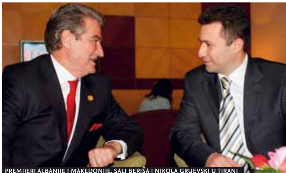
PREMIJERI ALBANIJE I MAKEDONIJE, SALI BERIŠA I NIKOLA GRUEVSKI U TIRANI

24. novembar – U Tirani je završen skup 18 zemalja članica Centralnoevropske inicijative (CEI), sa zaključkom iz završnog dokumenta da je evropska perspektiva vodeća snaga i faktor stabilnosti za proces reformi.