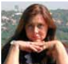
PIŠE: ALEKSANDRA MIJALKOVIĆ

Srbija, Crna Gora, Makedonija, Albanija i Bosna i Hercegovina proteklih godinu dana nisu iskoristile da ubrzaju približavanje Evropskoj uniji. Brisel je u međuvremenu sačinio predlog smernica kojima se, praktično, odlaže i otežava prijem novih članica