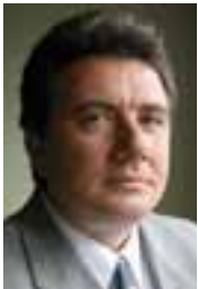
PIŠE: DR JOVAN TEOKAREVIĆ

Najveći deo najboljeg mogućeg scenarija evroatlantskih integracija za 2006. nije se ostvario i to ne samo u našem slučaju, nego i u slučaju većine drugih zemalja zapadnog Balkana, čiji se broj u međuvremenu povećao