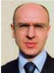
PIŠE: SRĐAN GLIGORIĆ

Evropska bezbednosna i odbrambena politika (ESDP) i NATO nisu konkurentске opcije, već komplementarni oblici saradnje na polju bezbednosti i odbrane. Uključenjem bezbednosnog elementa u proces evropske integracije zemalja zapadnog Balkana može se suštinski podstaći uspostavljanje stabilnosti u regionu i samim tim njegov ukupni razvoj