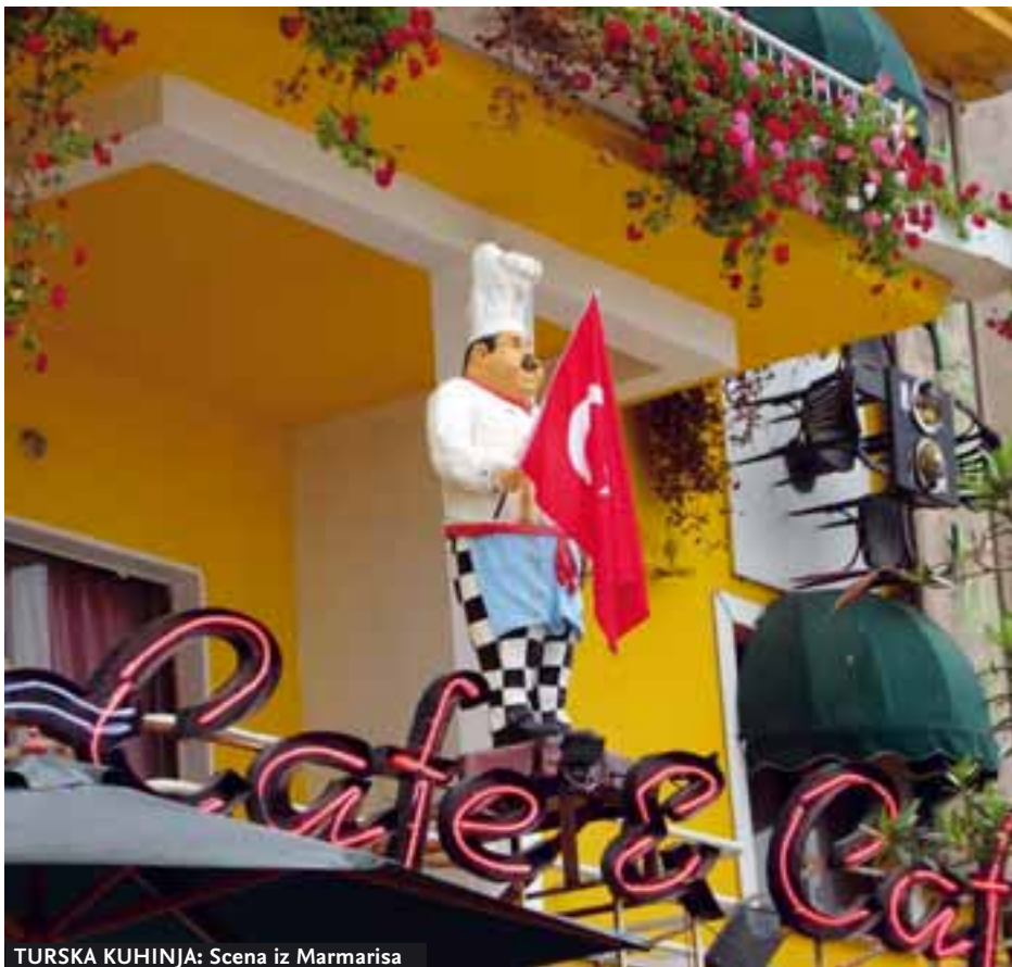
TURSKA KUHINJA: Scena iz Marmarisa

luke i aerodrome za Republiku Kipar (jednu od 25 članica Unije) uz uslovljavanje da će to uraditi tek pošto EU ukine sankcije koje je uvela turskom, severnom delu ovog ostrva, nije pribavilo Turskoj simpatije "dvadesetpetorke". Naprotiv. Tako je javnost Unije ostala uglavnom ravnodušna na one retke pohvale iz izveštaja Evropske komisije o Turskoj, ističući mnogobrojne propuste, od tvrdoglavosti prema Kipru, pa do mnogobrojnih slučajeva kršenja ljudskih prava i sloboda, mučenja, politike "nulte tolerancije" i neusklađenosti sa evropskim standardima. Na meti je posebno zloglasni član 301. Krivičnog zakona, na osnovu kojeg su proganjani i zatvarani mnogi slobodoumni pisci i novinari, među kojima i dobitnik Nobelove nagrade za književnost Orhan Pamuk. Turski premijer Redžep Tajip Erdogan je, doduše, najavio ukidanje ovog člana, ali se u međuvremenu njegova vlada zamerila Francuzima (koju su podržale i neke druge članice EU-a) zato što ne priznaje genocid nad Jermenima 1915. godine.